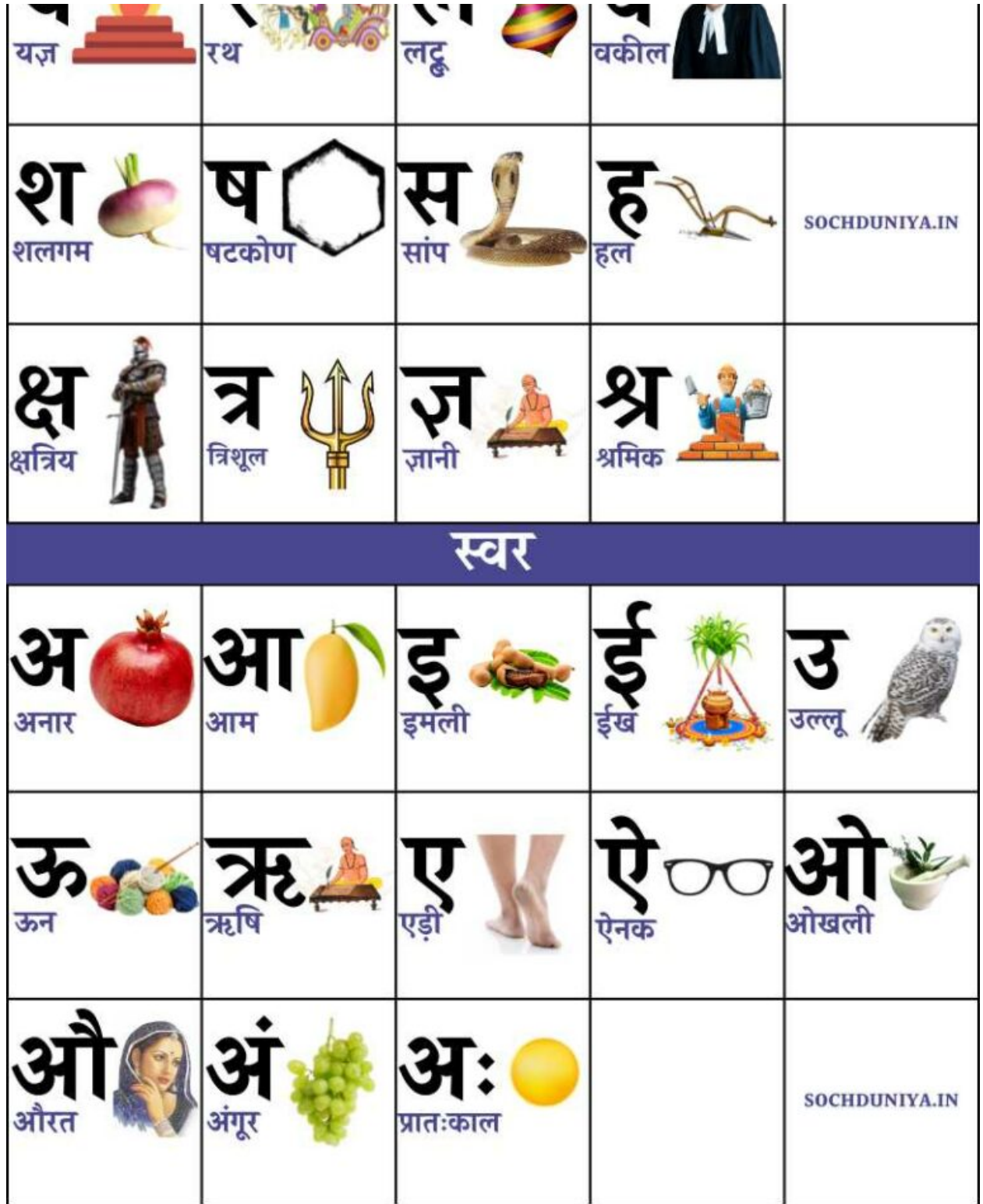
Hindi Varnamala Chart